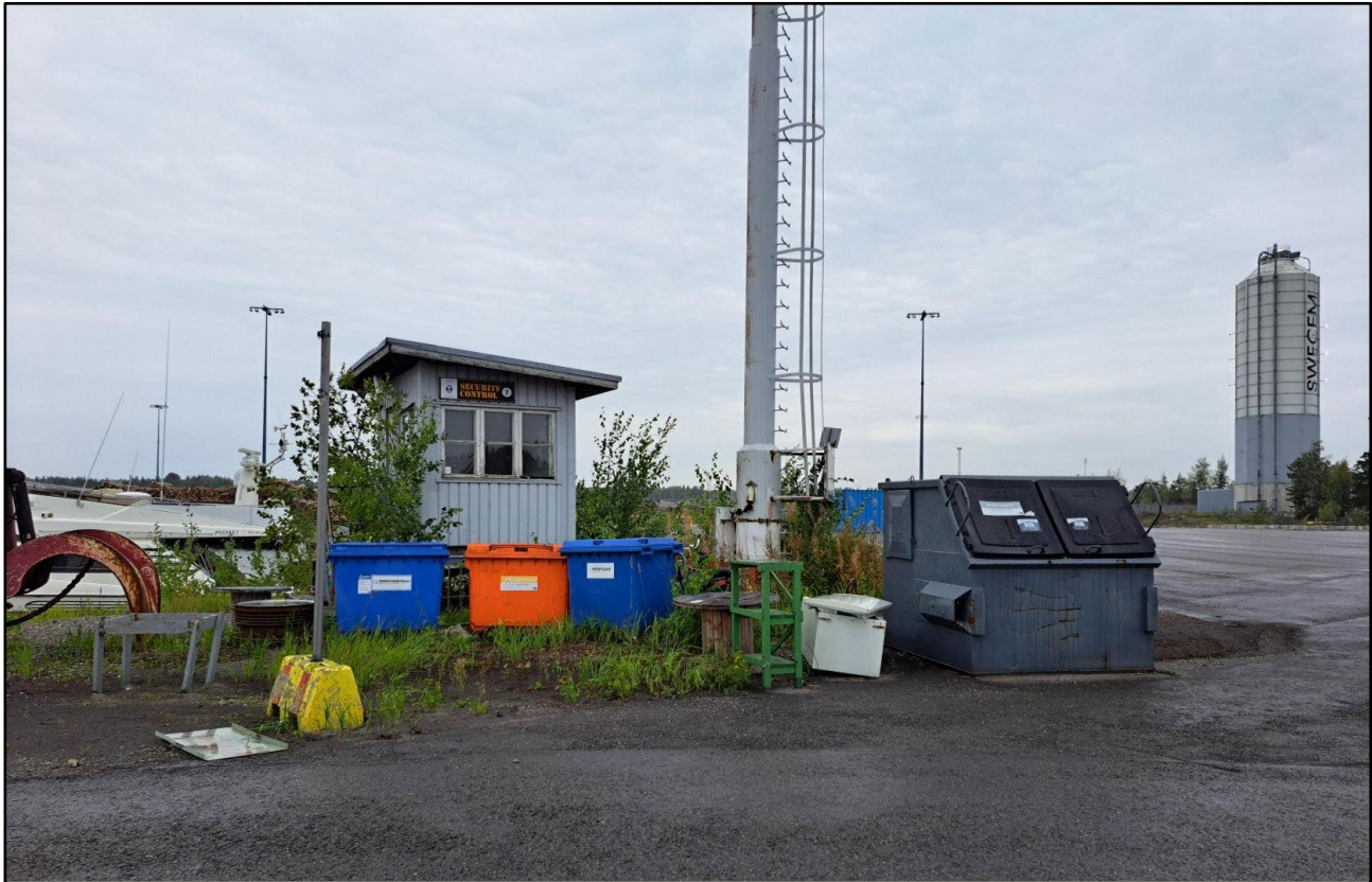
KUVA 3. SATAMA-ALUEEN AINOA JÄTEPISTE LAITURIN KOV2 PÄÄDYSSÄ.