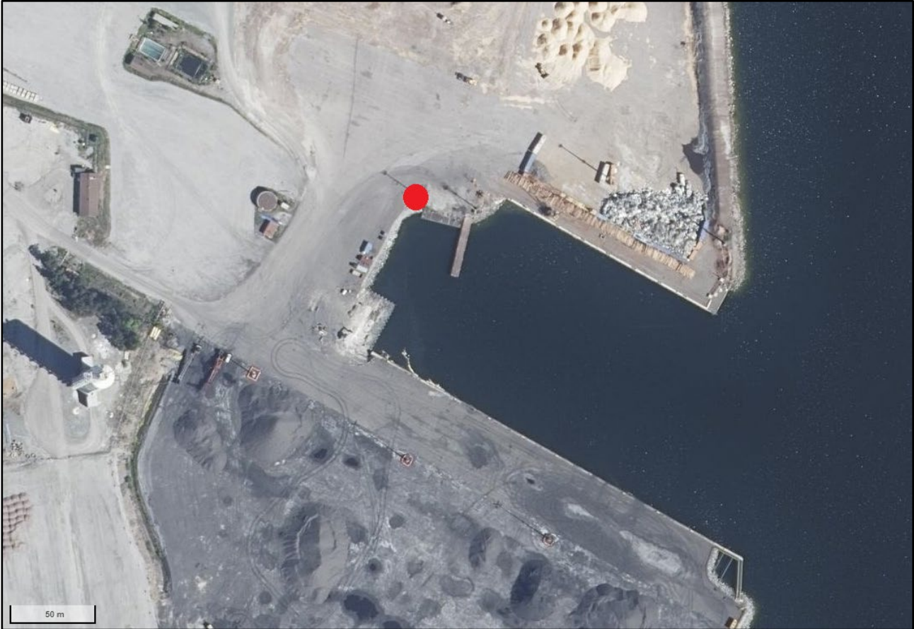
Kuva 2. JÄTEPISTEEN SIJAINTI KOVERHARIN SATAMAN ALUEELLA. JÄTEPISTE MERKATTU PUNAISELLA PISTEELLÄ. (MAANMITTAUSLAITOS)

Sataman vastaanottolaitteiden puutteellisuudesta tulee ilmoittaa sataman pitäjälle, joka ryhtyy tarpeellisiin toimiin. Ilmoituksen voi tehdä myös IMO:n ohjeistuksen (MEPC.1/Circ.834/Rev.1) mukaisella lomakkeella. Ilmoitukset käsitellään asianmukaisesti ja viiveettä sisäisesti Hangon Satama Oy:ssä. Sataman pitäjän yhteystiedot löytyvät tästä dokumentista ja Hangon Sataman verkkosivuilta.